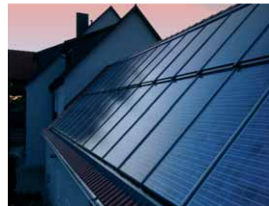
Aufdachanlage mit 12 kW/p

Eine bundesweite Distribution und die Zusammenarbeit mit regionalen Fachpartnern in den Bereichen Dachverlegung und Montage, Elektro und Heizungsbau, Steuern und Finanzen, sowohl bei reinen Modullieferungen als auch bei schlüsselfertigen Anlagen garantieren Ergebnisse, die sich sehen lassen können.