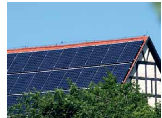
Aufdachanlage mit 40 kW/p