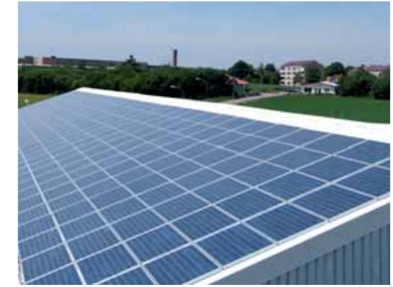
Aufdachanlage mit 100 kW/p