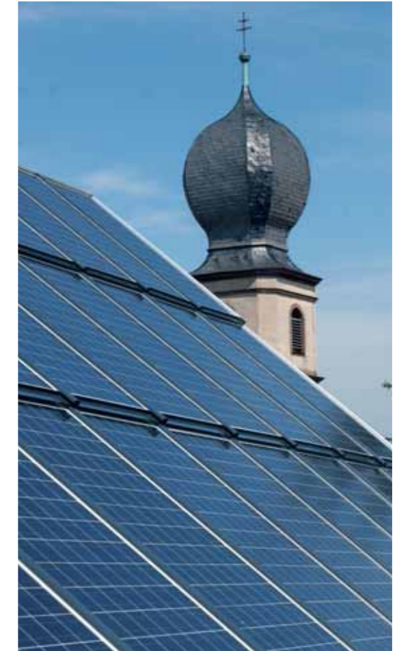
Indachanlage mit 30 kW/p