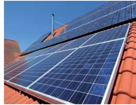
Aufdachanlage mit 15 kW/p