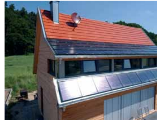
Indachanlage mit 5 kW/p